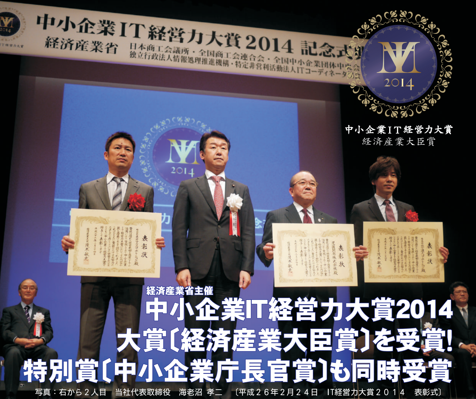
中小企業IT経営力大賞 経済産業大臣賞